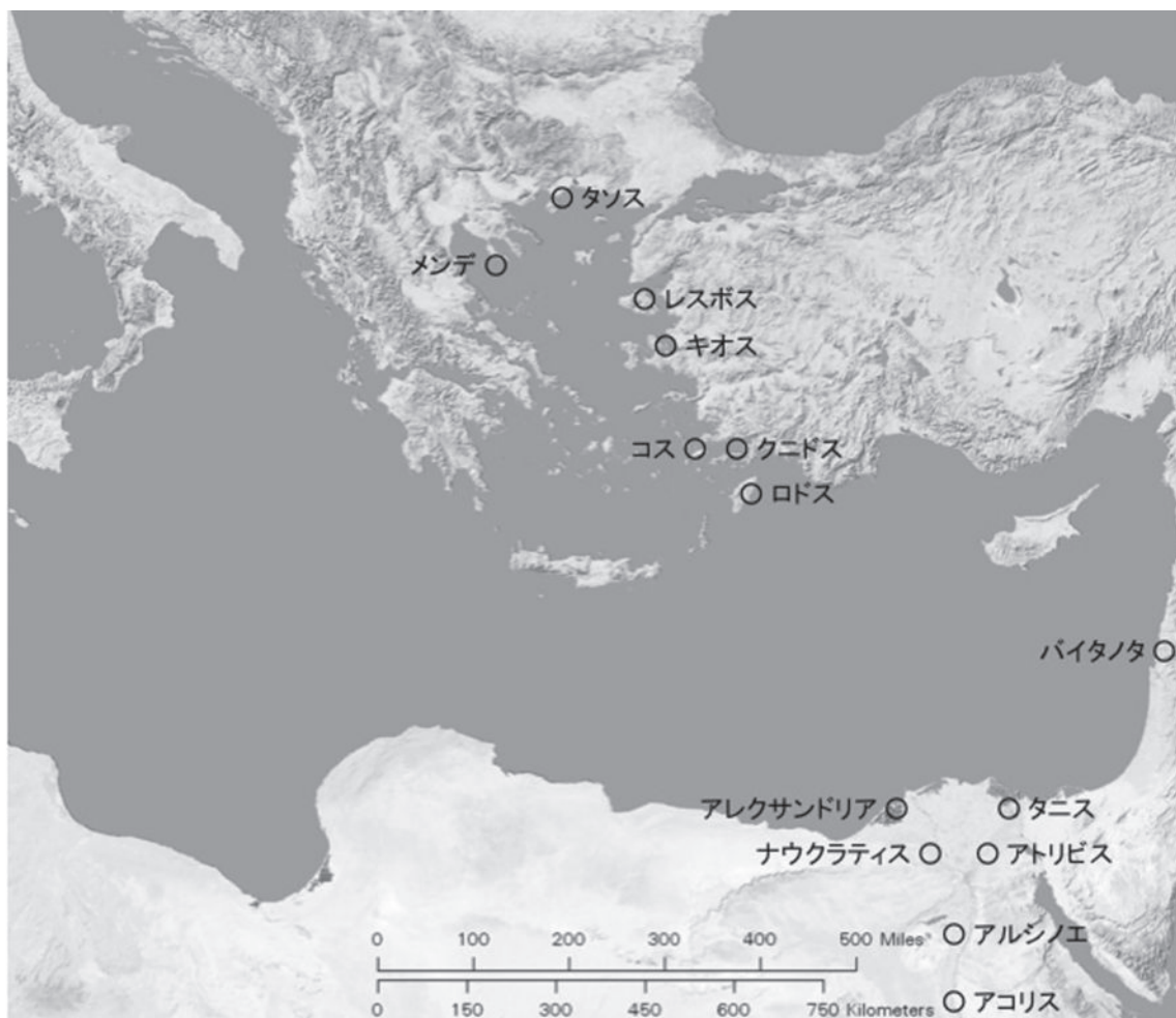
図1 東地中海と本文中で言及した主要な都市

幸いにも、ヘレニズム時代の東地中海の場合には、他文化の社会とは異なって文字史料が相対的に豊富に伝存するため、穀物やワインのようにモノとしては残らない物資の交易についても、一定の考察を加えることが可能である。しかも、ワインについては、主にワインの海上交易に用いられたと考えられる運搬用の土器であるアンフォラが遺物として幅広く出土するため、これを手がかりとする研究が