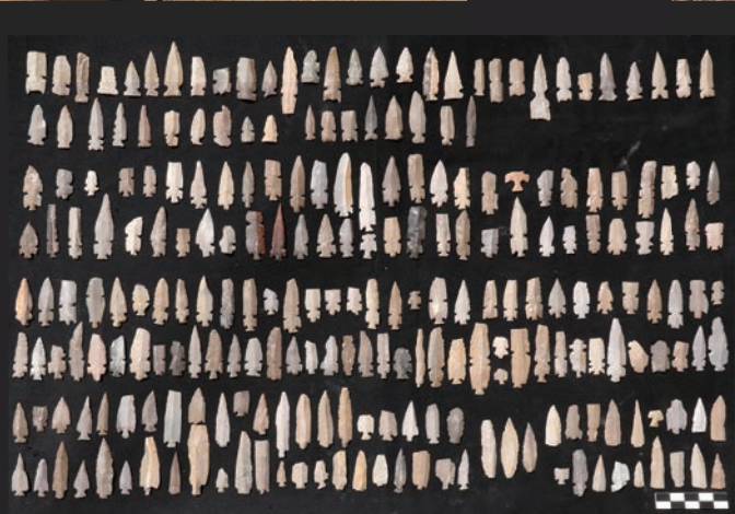
ハラアト・ジュハイラ202号遺跡出土石器(ヨルダン)