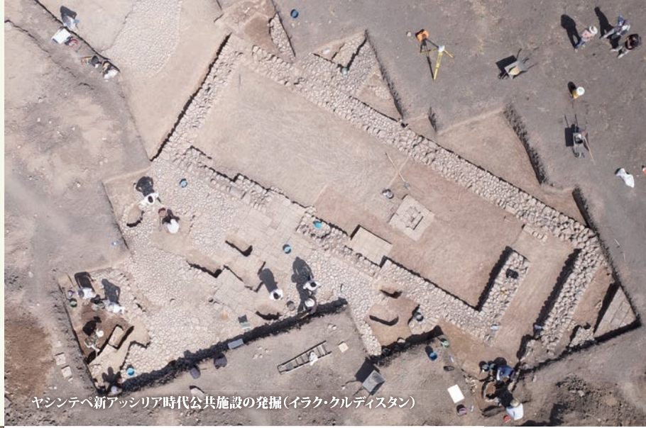
ヤシンテベ新アッシリア時代公共施設の発掘(イラク・クルディスタン)

The 24th Annual Meeting of Excavations in West Asia