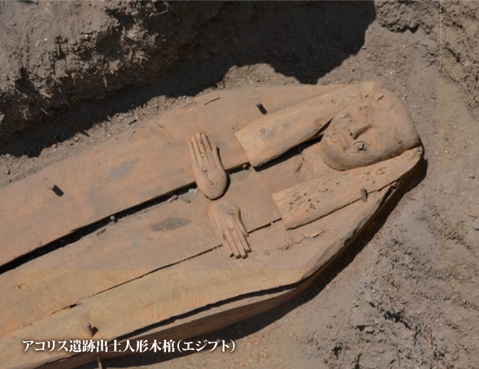
アクリス遺跡出土人形木棺(エジプト)